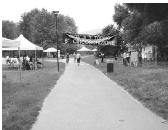
segue da pagina 1

posto), sono ora suddivisi in quattro parti e attendono altre forme di finanziamento. Il prossimo anno si dovrebbe avviare il secondo lotto pertinente alla sponda dal lato dell'Arrivore, mentre si rinvia, insieme all'esecuzione del primo lotto, il problema della comunità di immigrati che attualmente trova ricovero sull'altra riva del fiume, quella fronte Iveco in Lungo Stura Lazio (area appunto del primo lotto).